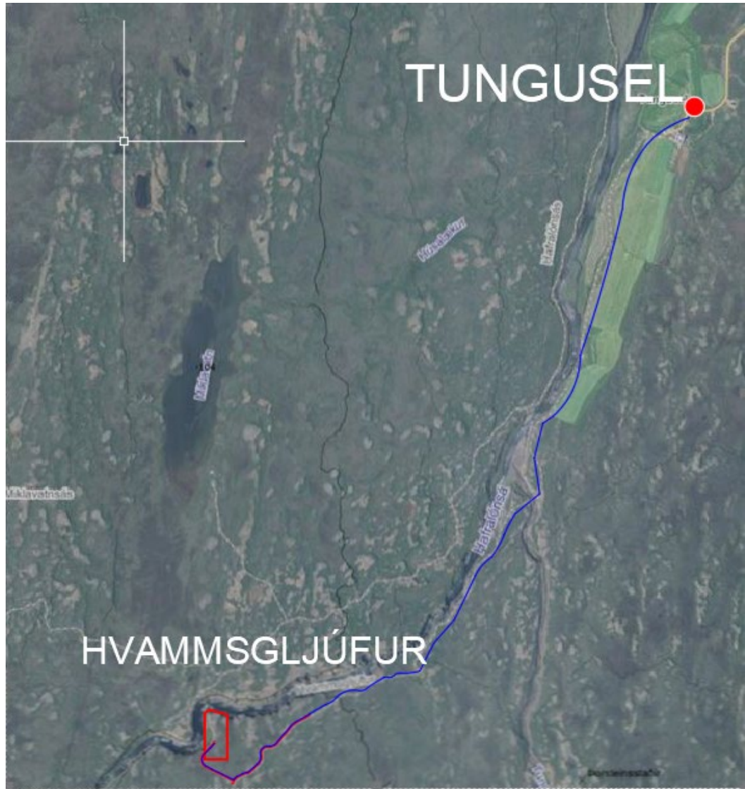
Mynd 1 Afmörkun deiliskipulagssvæðis.