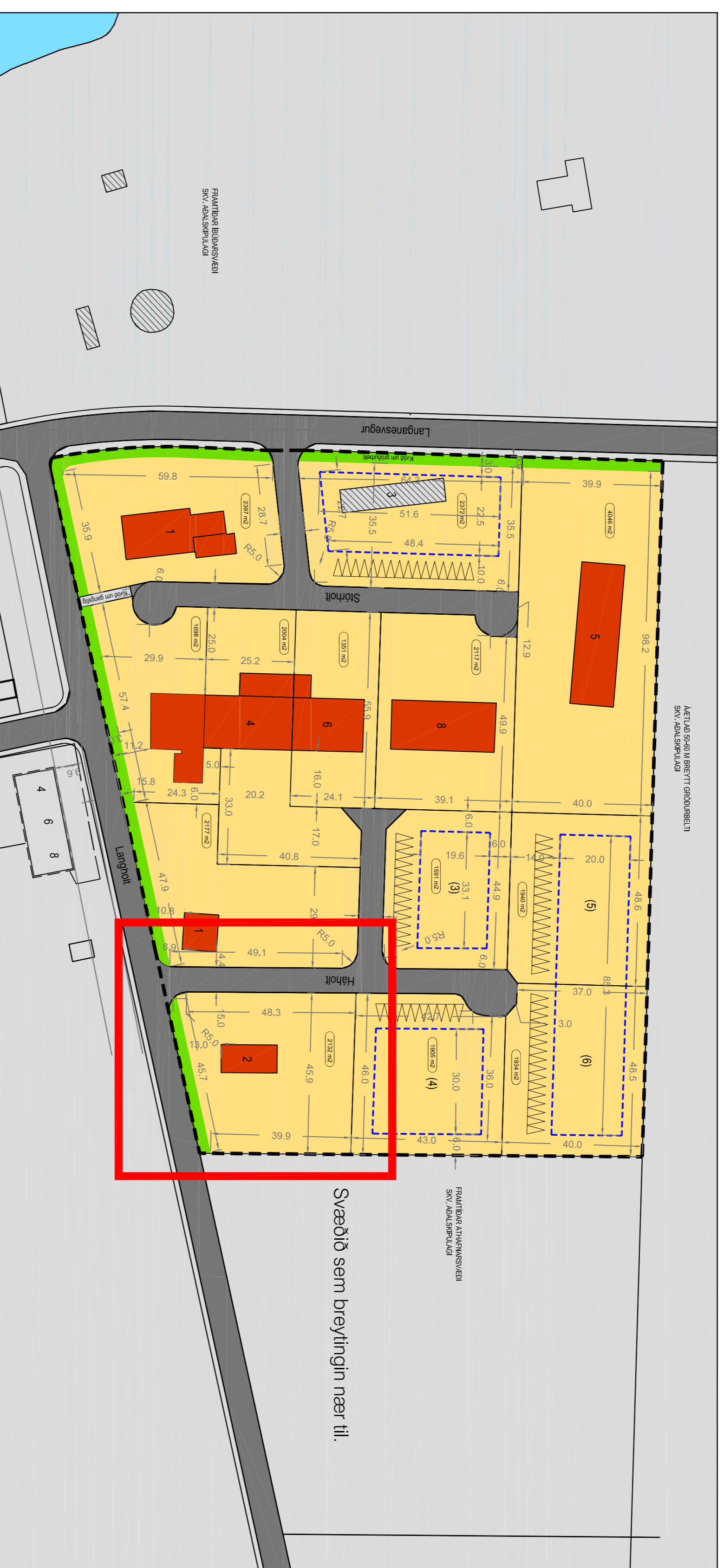
Giltandi deiliskipulag, samþykkt í sveitarstjórn 31. maí 2005.