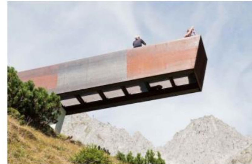
Útsýnispallur sem virðist vaxa út frá landinu.

Uppbygging á ákveðnum útsýnispunktum með samskonar yfirbragð, sem saman mynda slóða sem leiðir gestinn áfram. Ljóðrænar merkingar vekja fólk til umhugsunar og efniviðurinn fellur vel að landslaginu.