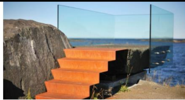
Útsýnispallur við Askevågen .

Uppbygging sem eykur landslagsupplifun og efnisvalið fellur vel að hrárrí náttúrunni.