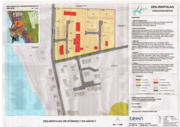
Deiliskipulag við Stórholt og Háholt (2005) fellur úr gildi við gildistöku nýs deiliskipulags