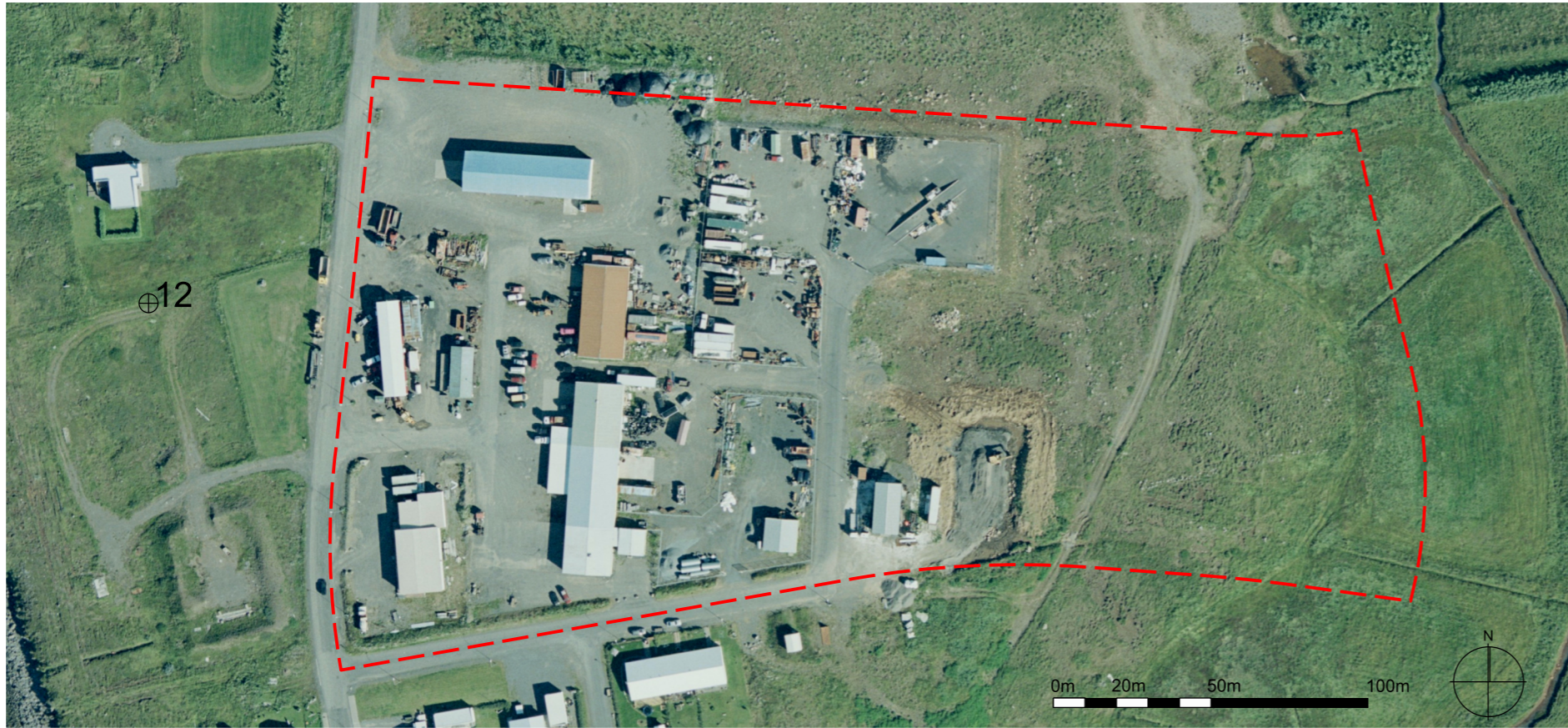
Afmörkun skipulagssvæðis 4,8 ha (Loftmyndir ehf.)