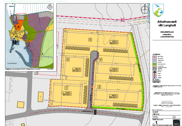
Deiliskipulag athafnasvæðis við Langholt (2014) skipulagið óðlaðist aldrei lögformlegt gildi